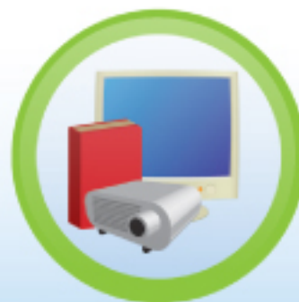
Kombinovani model nastave